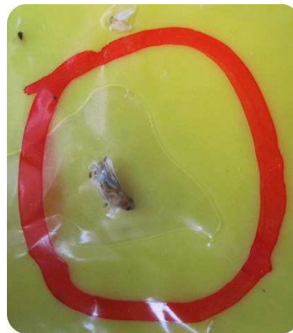
Adulto di scafoideo su trappola cromotattica